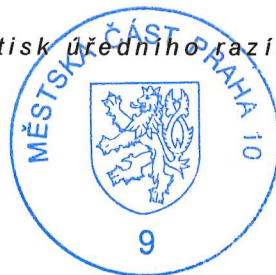
Ing. Radim Skála vedoucí referátu komunikací

Vydání tohoto rozhodnutí podléhá podle zákona č. 634/2004 Sb., o správních poplatcích, v platném znění, a jeho přílohy sazebníku poplatků, položky 36, zaplacení správního poplatku ve výši 500,- Kč před vydáním tohoto rozhodnutí podle § 5 odst. 2 téhož zákona.