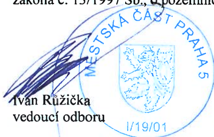
Ivan Růžička vedoucí odboru

Odvolání proti tomuto rozhodnutí v části II. nemá odkladný účinek ve smyslu ust. § 24, odst. 4, zákona č. 13/1997 Sb., o pozemních komunikacích, ve znění pozdějších předpisů